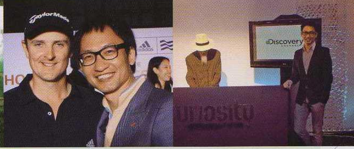
>> 國際著名運動品牌adidas及Discovery Channel亦採用了Sky Work的香氣服務。